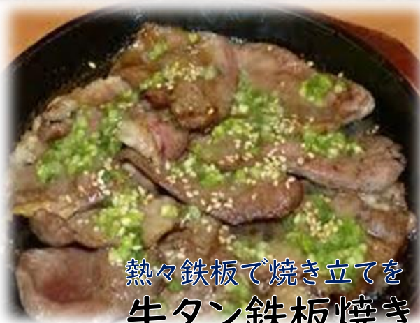
熱々鉄板で焼き立てを 牛タン鉄板焼き