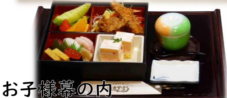
お子様幕の内 1180円(税込1298円) お子様ドリンクバー付