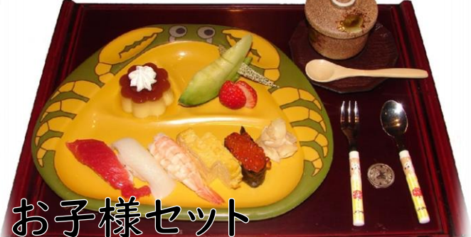
お子様セット 680円(税込748円) お子様ドリンクバー付