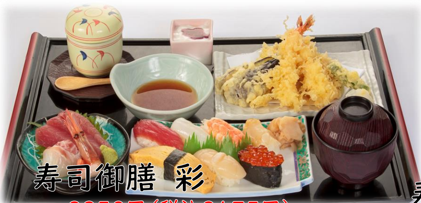
寿司御膳 彩 2250円(税込2475円)