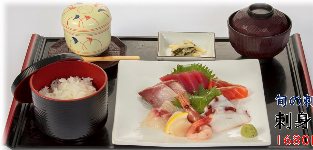
旬の刺身七点盛です 刺身御膳 浜