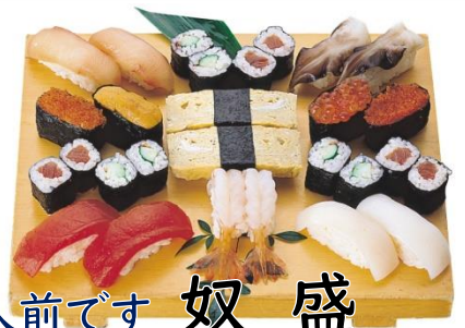
2人前です 奴盛 3500円(税込3850円)