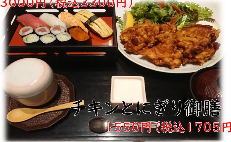
チキンとにぎり御膳 1550円(税込1705円)