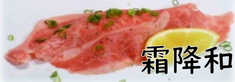
霜降和牛あぶり 680円(税込748円)