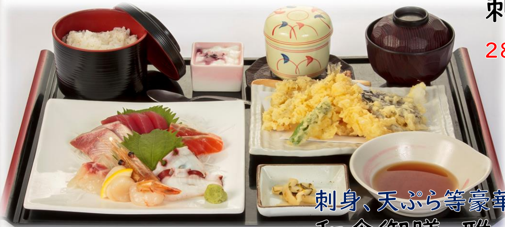
刺身、天ぷら等豪華な御膳