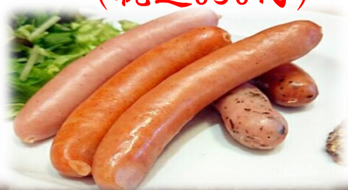
プレーン、チョリソー、カレー ハーブ、黒こしょう味