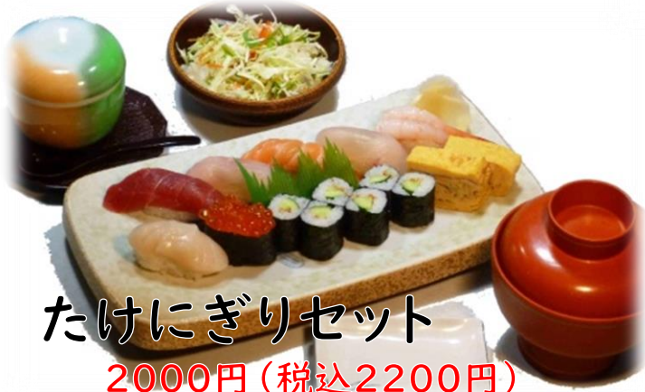
たけにぎりセット 2000円(税込2200円)