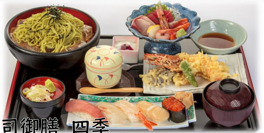
寿司御膳 四季 3000円(税込3300円)