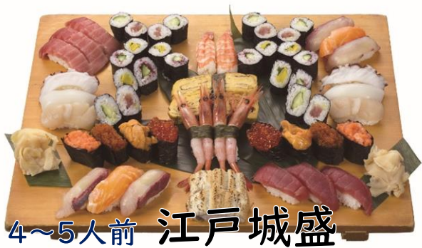
4~5人前 江戸城盛 6500円(税込7150円)