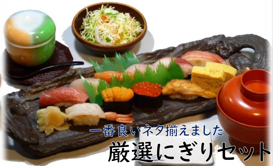
一番良いネタ揃えました 厳選にぎりセット 3200円(税込3520円)