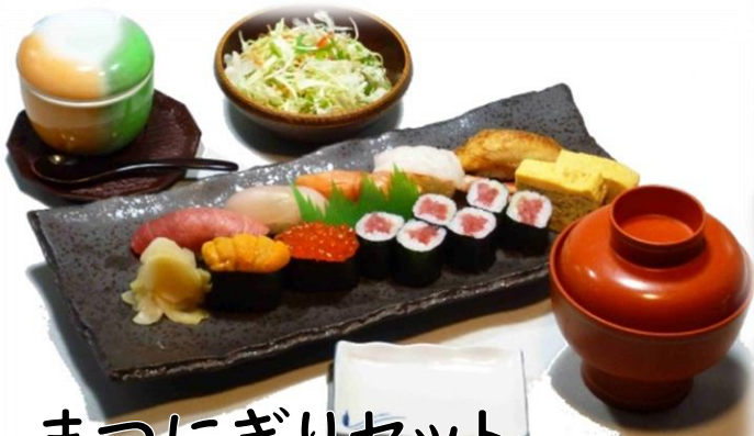
まつにぎりセット 2400円(税込2640円)