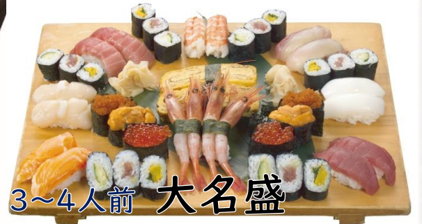
3~4人前 大名盛 5000円(税込5500円)