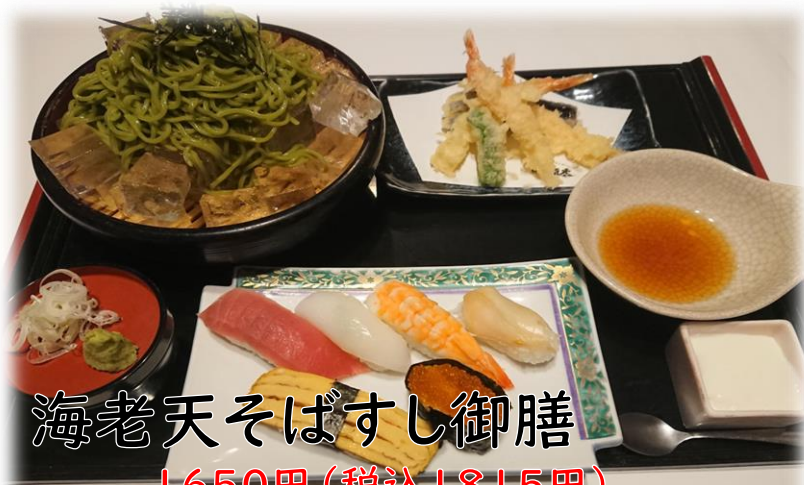
海老天そばすし御膳 1650円(税込1815円)