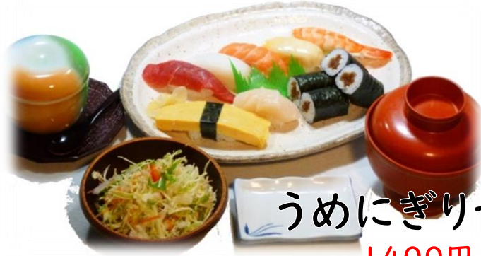
うめにぎりセット 1400円(税込1540円)