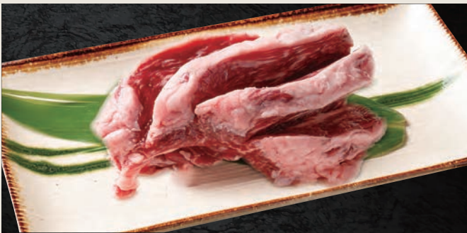
大判ハラミ 1,630円 (税込)