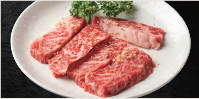
アンガス牛カルビ 830円 (税込)