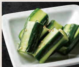
うま塩きゅうり 440円(税込)