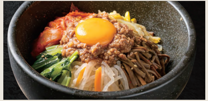
石焼ビビンバ 750円(税込)