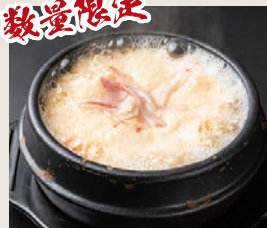
ケランチム 760円(税込)