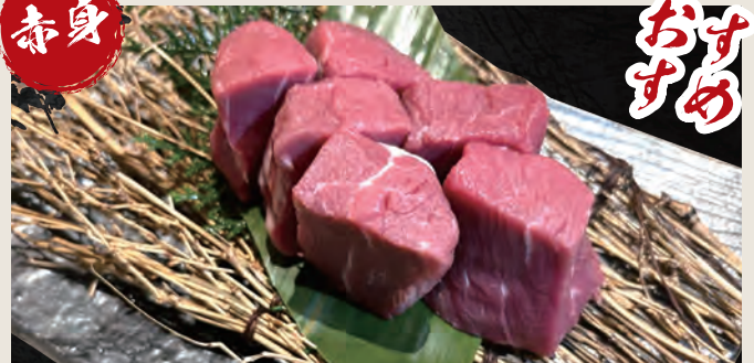
牛ヒレ 1,630円 (税込)