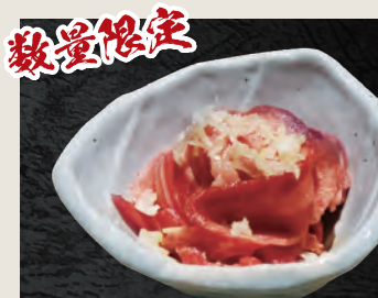
ねぎ塩漬け牛タン 1,190円(税込)