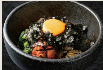
のりのり石焼ビビンバ 750円(税込)