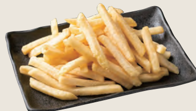
ポテトフライ 440円(税込)