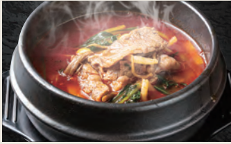
ユッケジャンスープ 650円(税込)