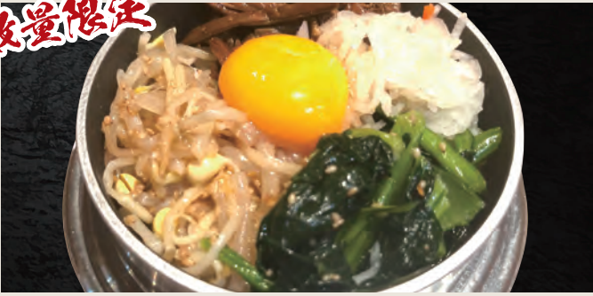
釜焼きビビンバ 990円(税込)