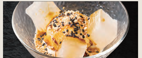
黒蜜わらびもちアイス