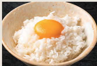
TKG ごはん 350円(税込)