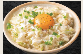
ネギたまご飯 400円(税込)