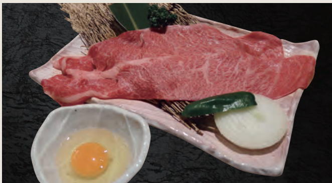
和牛すき焼きカルビ ・肩ロース芯 1,480円(税込)