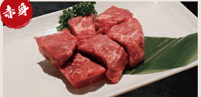
牛ミスジ 1,640円 (税込)