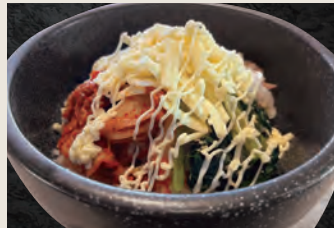
石焼チーズビビンバ 860円(税込)