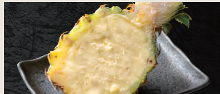
パイんシャーベット