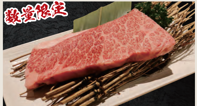
和牛ハネシタロース ・ザブトン 2,280円(税込)