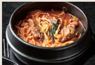
ユッケジャンラーメン 880円(税込)