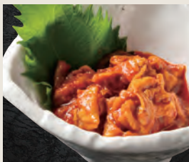
チャンジャ 530円(税込)