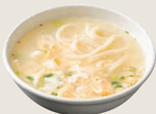
ふんわり玉子うどん 380円(税込)