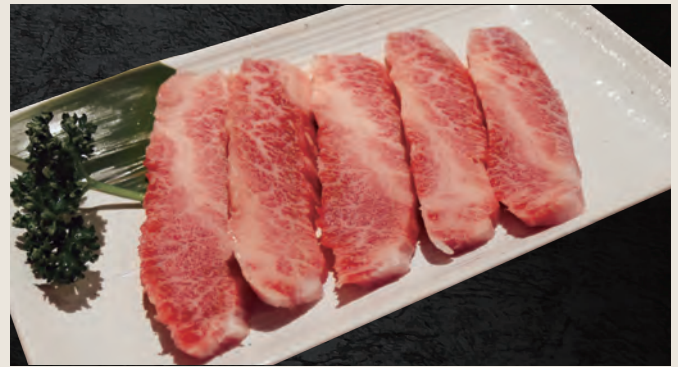
和牛特上カルビ ・三角バラ 2,260円(税込)