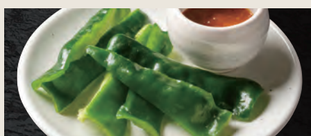
パリッと生ピーマン