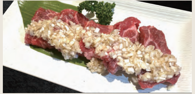
アンガスねぎ塩牛カルビ 870円 (税込)