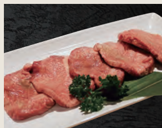
特上牛タン 1,580円(税込)