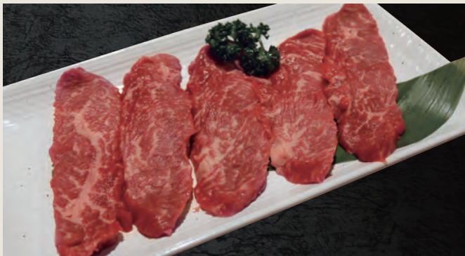
和牛上ロース ・肩ロース 1,880円(税込)