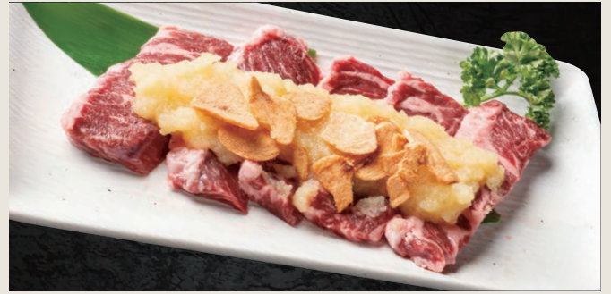
にんにく上ハラミ 1,410円 (税込)