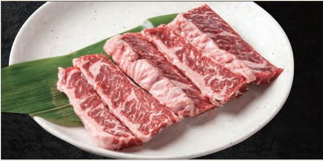
上ハラミ 1,290円 (税込)