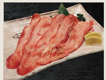
プレミアム大判牛タン 2,480円(税込)