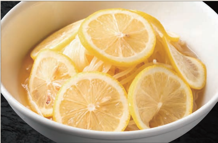
さっぱりレモン冷麺