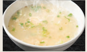
玉子スープ 420円(税込)