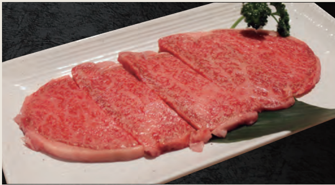
和牛上カルビ ・カイノミ・フランク・肩ロース 1,850円(税込)