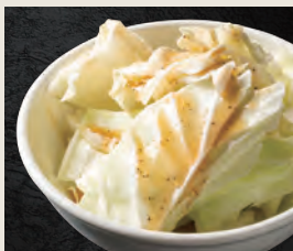
塩キャベツ 430円(税込)