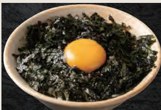
のりたまご飯 400円(税込)