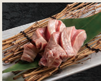
厚切り極み牛タン 1,820円(税込)