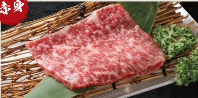
赤身大判 1,860円 (税込)