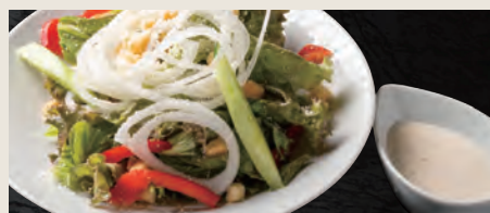
濃いめのシーザーサラダ