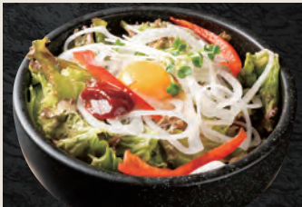
野菜たっぷり石焼ビビンバ 960円(税込)