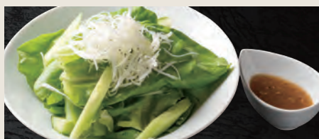
やみつぎげんいちサラダ