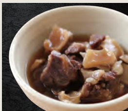
牛すじ煮込み 690円(税込)