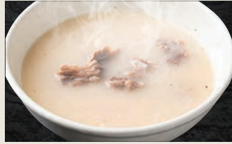
コムタンスープ 540円(税込)