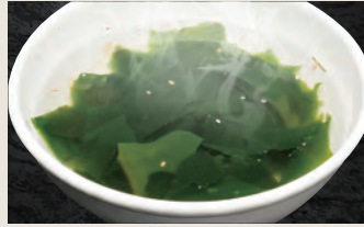
わかめスープ 420円(税込)