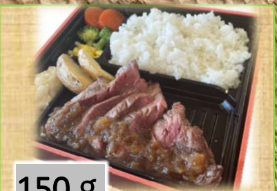
150 g 1,400円 ステーキ弁当