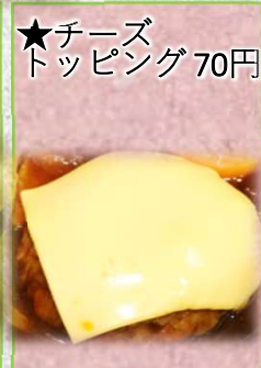
★チーズ トッピング 70円