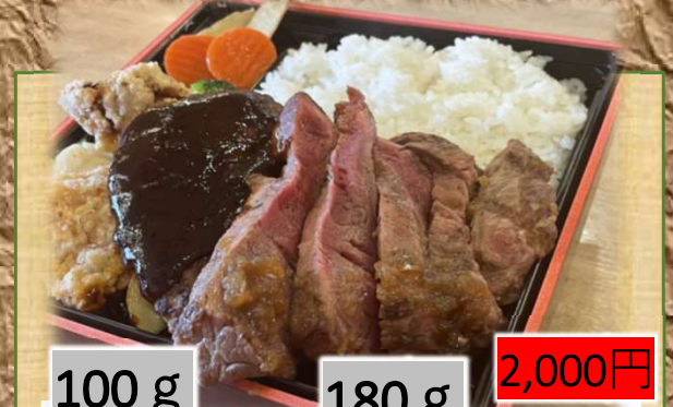
100 g 180 g 2,000円 ボリューム満点 ステーキ・ハンバーグ弁当