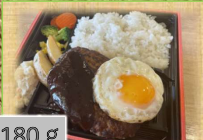
180 g 1,300円 デミグラス ハンバーグ弁当