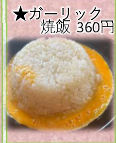
★ガーリック 焼飯 360円