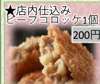
★店内仕込み ピニョコロッケ1個 200円