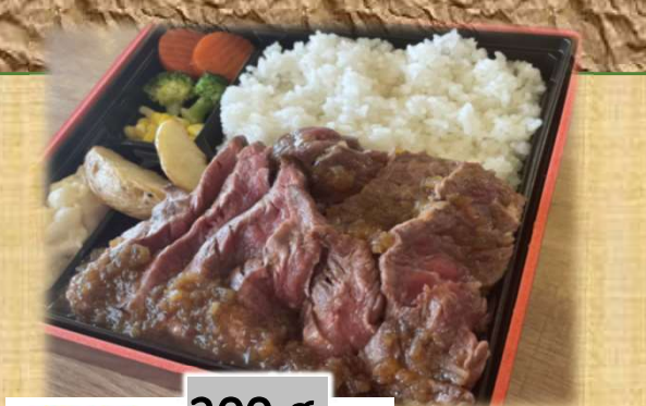
大満足 200 g 1,700円 ステーキ弁当