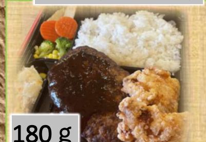
180 g 1,500円 ハンバーグ 鶏の唐揚げ弁当