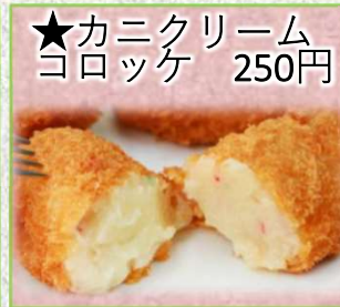
★カニクリーム コロッケ 250円